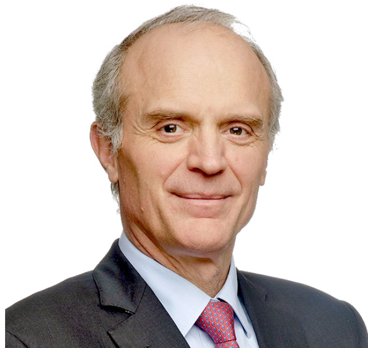
Florent Menegaux ประธานเจ้าหน้าที่บริหาร