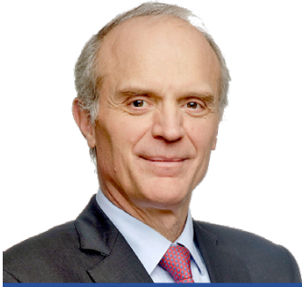
Florent Menegaux 首席执行官